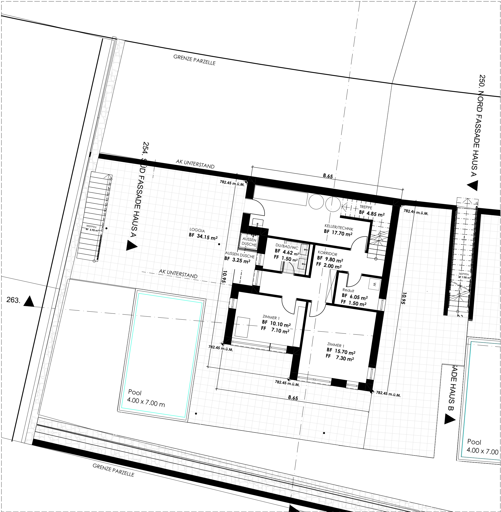
M01 Untergeschoss M: 1 : 1 0 0

MGA AG - Architektur - Bauleitung Hintere Bahnhofstrasse 9 - Postfach 301 8853 Lachen SZ Tel 055 451 60 90 Fax 055 451 60 99