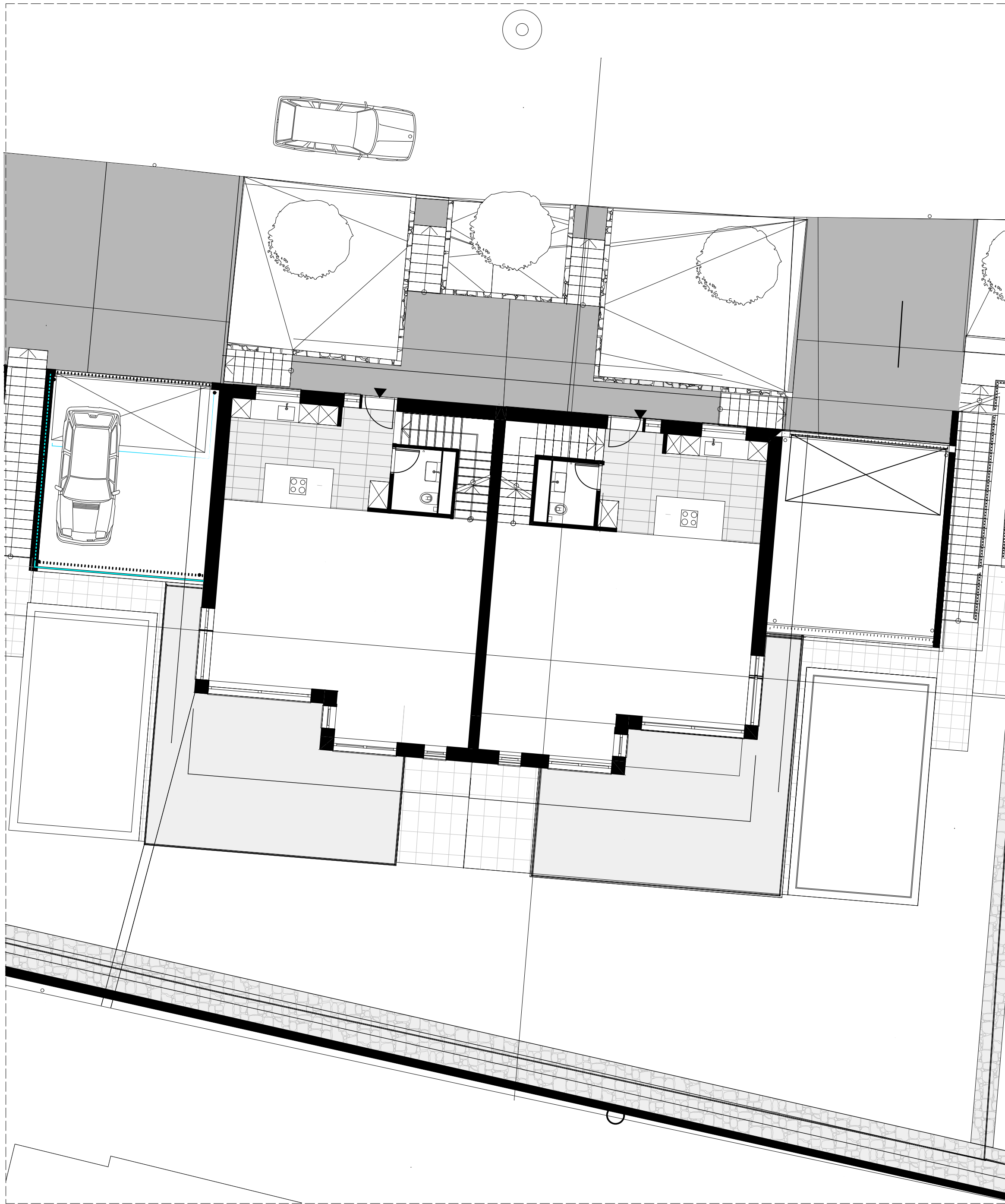
P00 Erdgeschoss M: 1 : 1 0 0