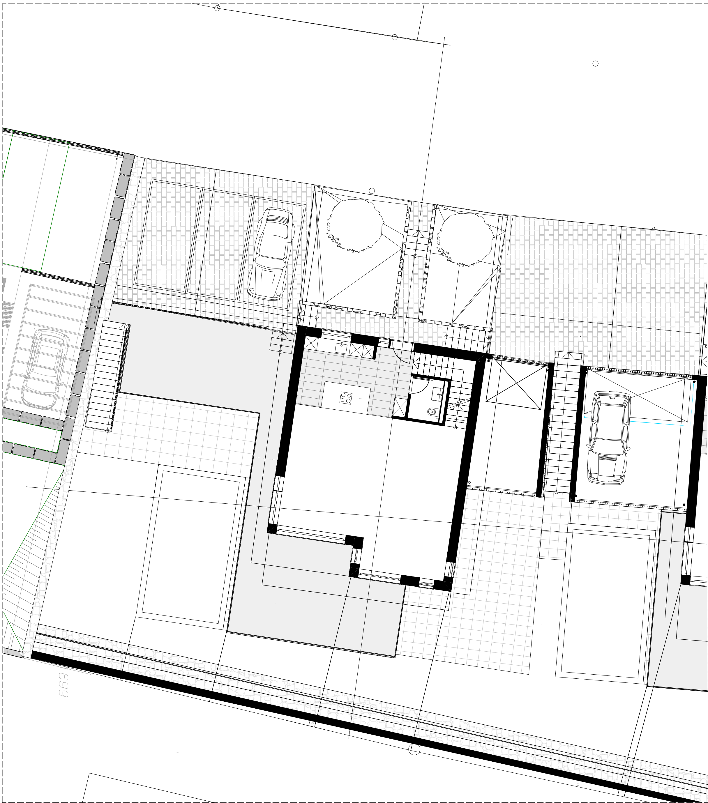
P00 Erdgeschoss M: 1 : 1 0 0